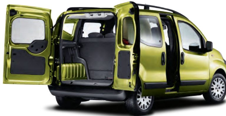
รถเอกประสงค์ สำหรับการใช้งานในชีวิตประจำวันอย่างทั่วถึง