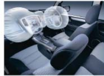
ฟอร์ด เอสเคป ใหม่ ได้รับมาตรฐานความปลอดภัยระดับสูงจากสถาบันผู้ขับขี่และยานยนต์สำหรับผู้ใช้รถใช้ถนน

ฟอร์ด เอสเคป ใหม่ ตอบสนองไลฟ์สไตล์ของผู้ที่รักการเดินทางโดยเปลี่ยนห้องโดยสารแบบเดิมๆ ให้เป็นห้องพักผ่อนเคลื่อนที่ที่สะดวกสบายกว้างขวางมากขึ้น ด้วยตำแหน่งความสูงของเบาะนั่งในสโตรัด SUV สามารถเพิ่มทัศนวิสัยในการขับขี่ที่ปลอดภัย รวมถึงเบาะที่นั่งแก้คุณภาพสูง ที่ดีไซน์ให้โอบกอดผู้โดยสาร: เพื่อลดอาการเมื่อยล้าเมื่อต้องเดินทางไกล พาสานกับอุปกรณ์อำนวยความสะดวกมากมาย ที่สั่งการเพียงปลายนิ้วสัมผัสผ่านปุ่มควบคุมต่างๆ ทั้งเครื่องเล่น CD แบบ 6 แผ่น พร้อม MP3 ปุ่มปรับระดับแสงของไฟส่องสว่างหน้าปิดทรงสปอร์ตระบบควบคุมความเร็วคงที่บนพวงมาลัย รวมถึงเบาะที่นั่งสามารถปรับเพิ่มพื้นที่รองรับส้นเท้าขนาดใหญ่ได้อย่างง่ายดาย อีกทั้งยังเพิ่มความปลอดภัยด้วยถุงลมนิรภัยคู่ SRS เพื่อรับรองความปลอดภัยของคุณและคนข้างๆ