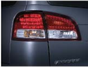
ไฟท้ายแบบ LED