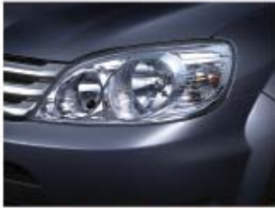
ไฟหน้าโคมเดี่ยวแฉกเป็น 3 ไดร์รูปทรงสามเหลี่ยมแฉก