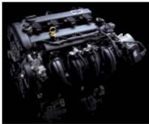
เครื่องยนต์ VVT ขนาด 2.3 ลิตรที่ตอบสนองการขับขี่อย่างคล่องตัวและประหยัดน้ำมัน