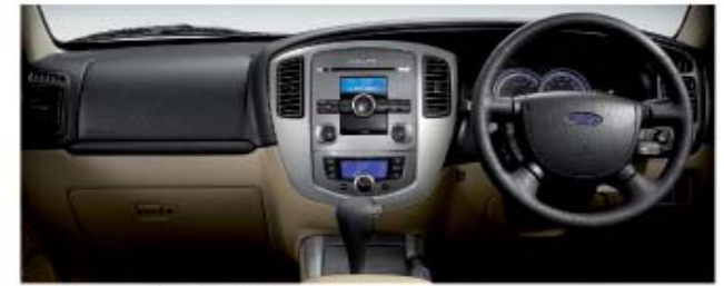
ความสูงที่ปรับได้ของเบาะนั่งในรถ SUV