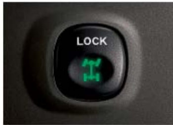
ปุ่มเพื่อระบบขับเคลื่อน 4 ล้อ Control Trac II แบบ On Demand เป็นความปลอดภัยและประสิทธิภาพการทรงตัวสูงสุด