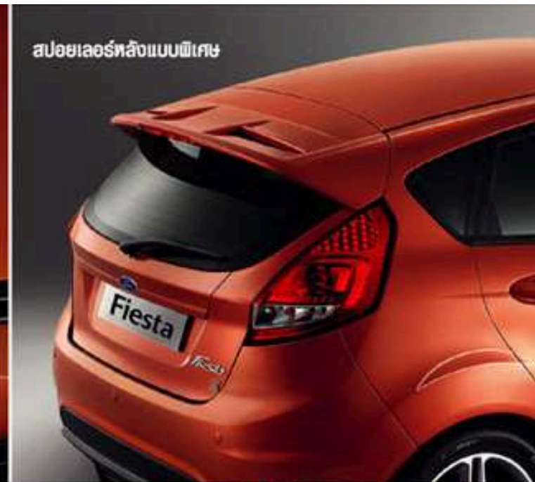
สปอยเลอร์หลังแบบพิเศษ