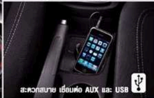
สะดวกสบาย เชื่อมต่อ AUX และ USB