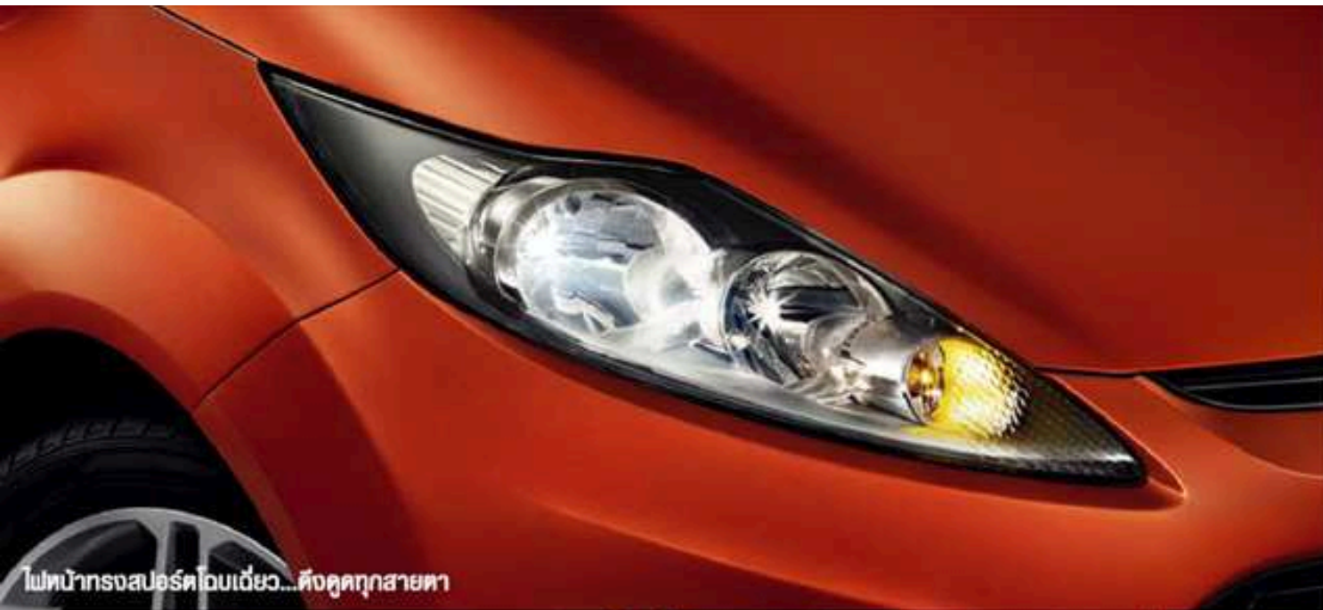
ไฟหน้าทรงสปอร์ตโอบเฉียง...ตั้งคู่ทุกสายตา