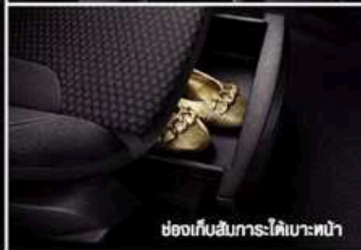
ช่องเก็บสัมภาระใต้เบาะหน้า