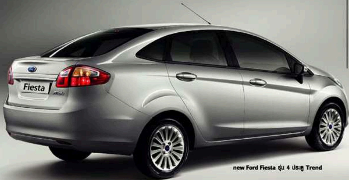
new Ford Fiesta รุ่น 4 ประตู Trend