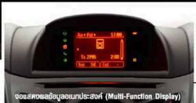
จอแสดงพลาสมาอเนกประสงค์ (Multi-Function Display)