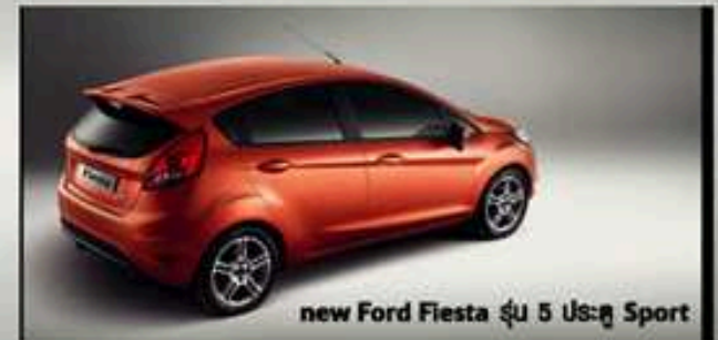
new Ford Fiesta รุ่น 5 ประตู Sport

ฟอร์ด เฟียสต้า โทป คือรูปลักษณ์ปราคาเปรี้ยวและเปสโตส ได้รับการออกแบบภายใต้แนวคิด "คเนอติก ดีไซน์" อันโดดเด่นของฟอร์ด สะท้อนความเก๋อารมณีสปอร์ตด้วยเส้นสายโฉบเฉี่ยวรอบคัน สรรค์สร้างเป็นอย่างพิถีพิถัน ให้ความรู้สึกถึงพลังแห่งความเคลื่อนไหว...แม้ยุคนี้ถึง ด้วยพลังของเครื่องยนต์เบนซิน 1.6 ลิตร ระบบ Ti-VCT เกียร์ PowerShift 6 Speed Dual-Clutch อัตโนมติ พร้อมพาคณะยานสูงสุดของความเร้าใจที่สัมผัสนุ่มนวลในทุกช่วงเวลาขับขี่ ก็ยังช่วยประหยัดน้ำมัน new Ford Fiesta มีให้เลือกทั้งในรุ่น 4 ประตู และรุ่น 5 ประตู การันตีด้วยหลากหลายรางวัลจากสถาบันชั้นนำ อาทิ รางวัล Red Dot Design Award สาขาออกแบบผลิตภัณฑ์ และรางวัลรถยนต์ยอดเยี่ยมแห่งปี 2009 จากนิตยสาร Auto Express, What Car ? และ Sun Motors มาครอบครอง