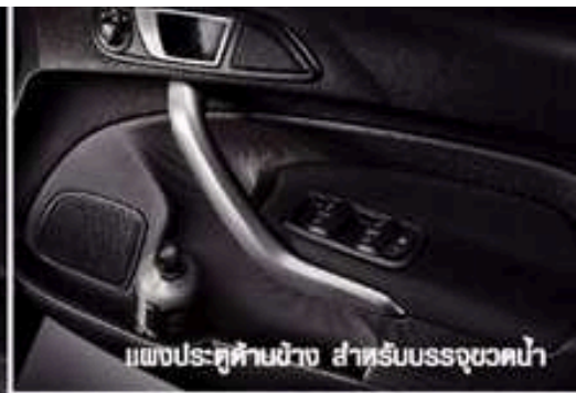
แผงประตูด้านข้าง สำหรับบรรจุมอเตอร์