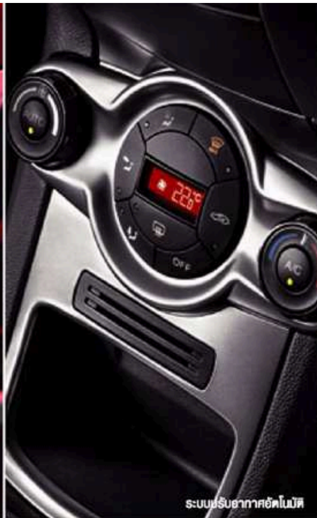
ระบบปรับอากาศอัตโนมัติ