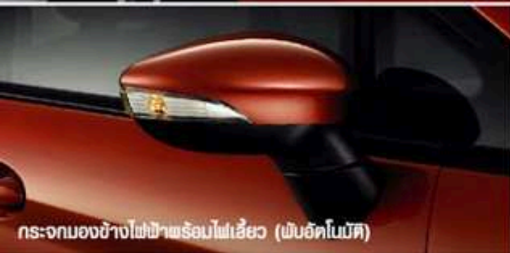
กระจกมองข้างไฟผ่าพร้อมไฟเลี้ยว (พับอัตโนมัติ)