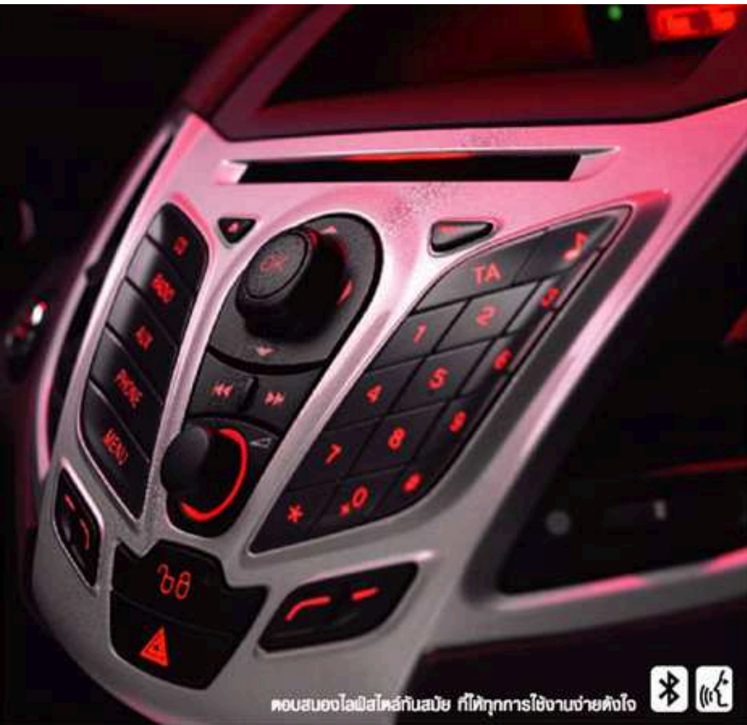
คอนโซลโพลีคาร์บอเนตกันรอย ที่ให้ทุกการใช้งานช่วยดึงใจ